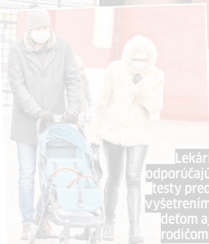
Lekári odporúčajú testy pred vyšetrením deťom aj rodičom.

Vzápätí pridal najnovšiu informáciu, podľa ktorej bez testu žiadne dieťa v bratislavskom ústave neosťria. „Veď je to mučenie, pchať do malého noštka tú hrubú vec,“ rozčuľoval sa rodič a pokračoval: „Je to choré a zvrátené! Viete si predstaviť, že podmienkou prevozu a prijatia doslova umierajúceho párhodinového novorodenca z Ružinova na