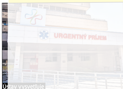
Usťav vysvetľuje priateľé opatrenia.

Otca malého chlapčeka nahnevalo časté testovanie.