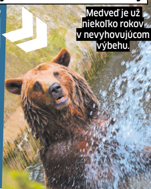
Medveď je už niekoľko rokov v nevhodujúcom výbehu.