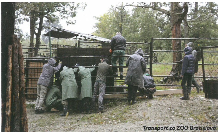
Transport zo ZOO Bratislava

ných divých bylinožravcov do pohoria Rodopy. Snaha nadácie je zachovanie jedinečnej biodiverzity Rodopov pre ďalšie generácie zapojením a zvyšovaním povedomia aj u miestnych obyvateľov. V októbri 2013 bolo vo východných Rodopách vypustených 5 zubrov európskych. V roku 2015 sa narodilo prvé mláďa. Do konca roku 2019 ich bolo až 5. O príchode ďalších jedincov do stáda, aby sa zachovala genetická rozmanitosť a udržala sociálna skupina, rozhoduje koordinátor genealogického registra - Európskeho rodokmeňa zubrov (EBPB). EBPB spolupracuje s majiteľmi zvierat a zabezpečuje evidenciu rodokmeňa zubrov európskych tak v chovných zariadeniach, ako i stád vo voľnej prírode. Adaptácia mladého zubra trvá približne jeden celý rok. Na začiatku žije zubor od-