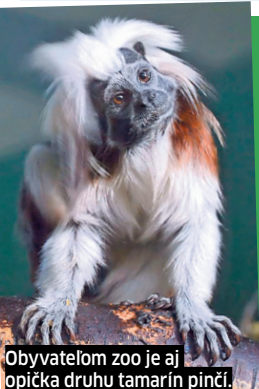
Obyvateľom zoo je aj opička druhu tamarin pincí.