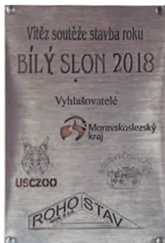
VÝBEH PRE VLKY v Bratislave získal viacero ocenení.