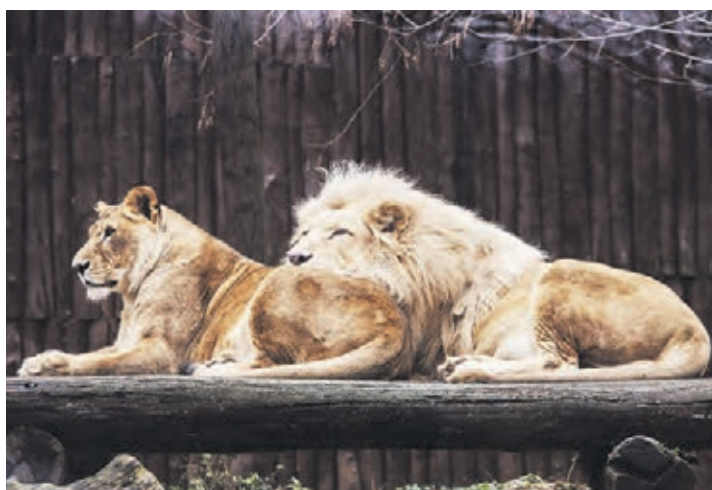
V BUDÚCNOSTI možno budeme vidieť šelmy v zoo aj loviť.