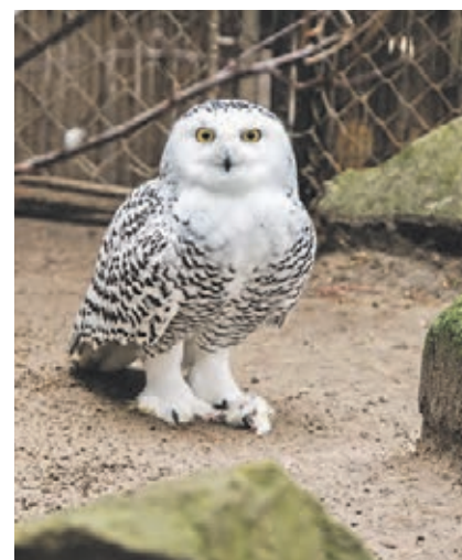
JEDNOU Z PLÁNOVANÝCH expozícií bude Karpatský les.