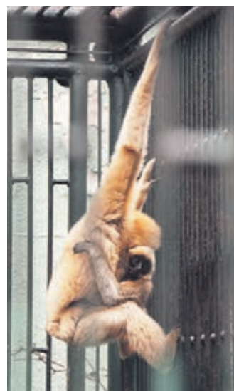
AJ ZVIERATÁ v zoo majú pracovný čas.