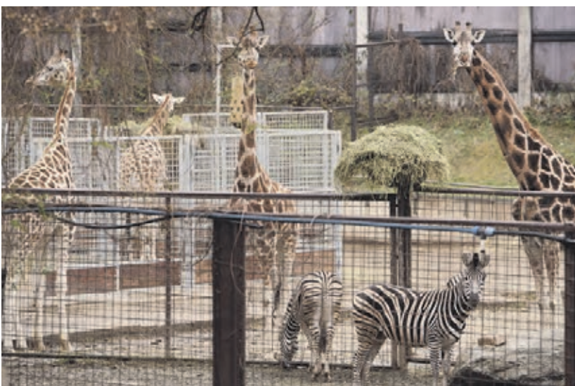
EXOTICKÉ ZVIERATÁ sú veľkým lákadlom zoo, trend je však spoznávať aj vlastnú divočinu.